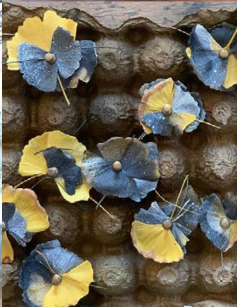
Crear con lo que tenemos a mano, el "efecto McGyver" generado como supervivencia durante el aislamiento