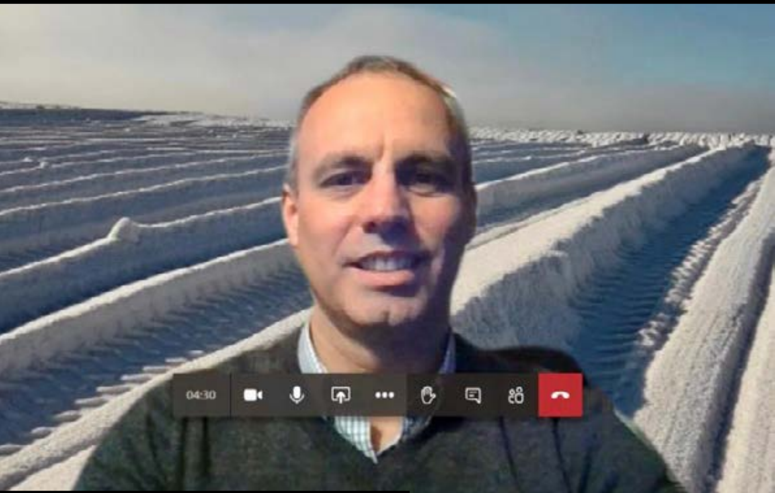
Salina La Colorada Grande, Gral San Martín, La Pampa