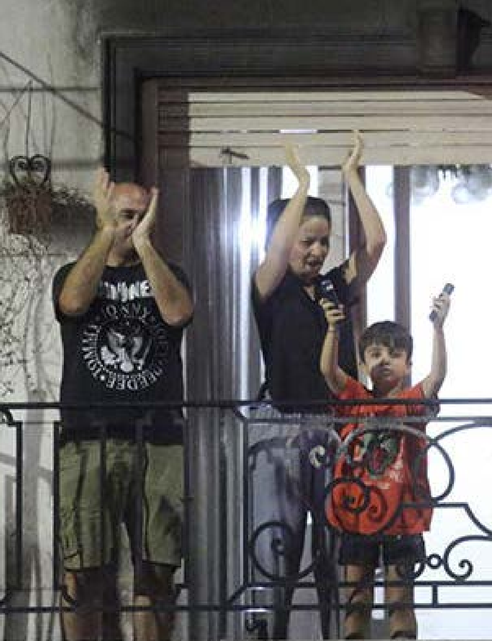
A las 21.00 los argentinos salían a aplaudir al personal médico que combatía la pandemia